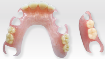
ノンクラスプデンチャー