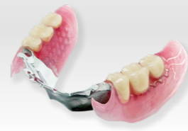
ノンクラスプデンチャー + 金属フレーム + シリコン